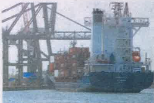
El AdA comenzará a ser positivo en vigencia desde agosto de este año.

El pilar comercial del acuerdo entrará en vigor de forma gradual el próximo 1 de diciembre a que falta que